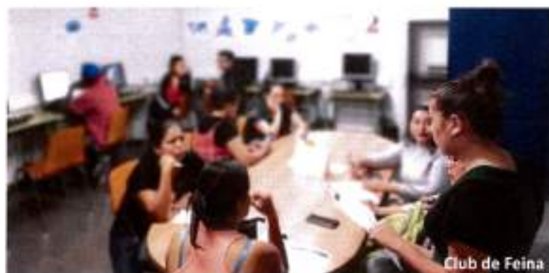
Club de Feina

Els itineraris són individualitzats en funció de les necessitats formatives de cada persona. En acabar la formació i la orientació laboral, la persona rep un certificat formatiu acreditat per la Secretaria d'Igualtat, Migracions i Ciutadania i per la Fundació "la Caixa" .