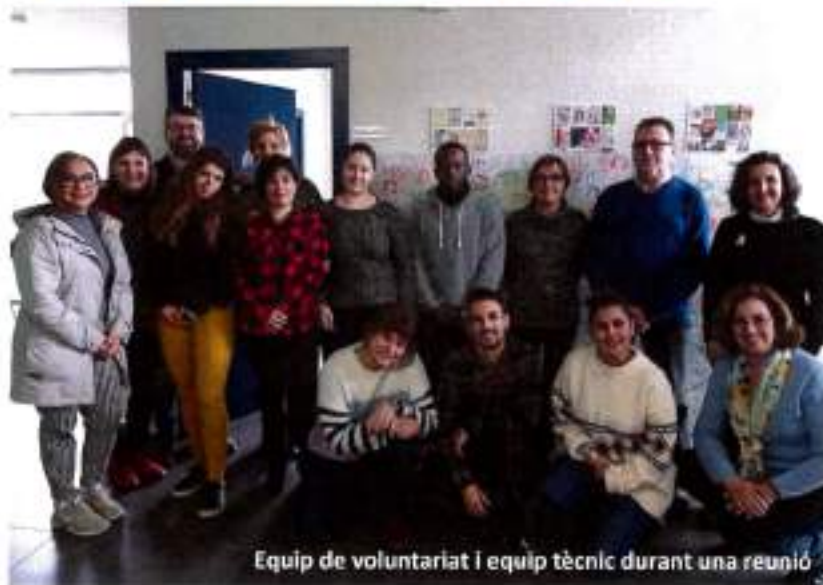
Equip de voluntariat i equip tècnic durant una reunió

La fundació va néixer fa 19 anys com una entitat de voluntaris i voluntàries, actualment aquest col·lectiu continua sent imprescindible i són el nostre gran actiu. La pluralitat i l'heterogeneïtat del voluntariat aporta una gran riquesa a l'entitat. Una base de gent associada, activa i participativa és el que dona sentit a la Fundació Integramenet perquè fa créixer l'entorn social pel qual treballam. L'equip tècnic i l'equip de voluntariat de cada servei tenen reunions periòdiques per recollir i abordar propostes de millora. També hi ha una reunió anual, com a mínim, que ens reuneix a tots.