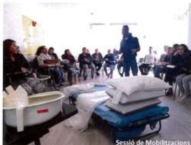
Sessió de Mobilitzacions